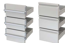
Teleskopzug Typ M Flaschenhöhen 245 / 245 / 245 mm