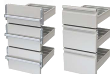
Teleskopzug Typ D Flaschenhöhen 185 / 265 / 265 mm