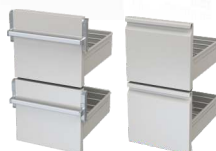
Teleskopzug Typ B Flaschenhöhen 360 / 365 mm