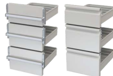
Teleskopzug Typ D Flaschenhöhen 185 / 265 / 265 mm