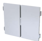
Doppeltür Typ DTA anstatt 2 Einzeltüren